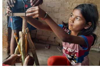
साधने प्रकल्प, बोराळा - मोबाइल स्टॅण्ड बनवताना