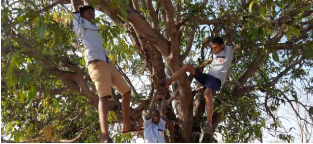
खेळ प्रकल्प, पाथडी - स्थानिक खेळाचे व्हिडीओ बनवताना