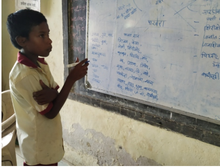
पक्षी प्रकल्प, कासटवाडी - माईड मॅप मांडताना

यासर्व विषयात मुलांना असणारी माहिती एकत्र आणणं हा अभ्यासाची पहिली पायरी. माहितीचा आकार किती मोठा आहे आणि तो तथ्यांच्या पलिकडेही शोधायला हवा, हे आम्हाला जाणवून देणारा हा टप्पा. पक्षी पाहत-पकडत आणि खातच इतकी वर्षं वाढलेल्या आमच्या पोरंसाठी ही सुरुवात सोपी होती. आपल्याला माहीत असणाऱ्या पक्ष्यांची नावं लिहायला घेऊ म्हणून एकदा सुरुवात झाली आणि जे पटपट आठवत होतं तिथं येऊन गाडी थांबली.