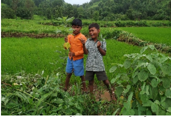
रानभाज्या प्रकल्प, रामखिंड - जंगलाचा परिघ फिरताना

सुरुवात करताना मुलांचं आजवरचं जग काय आहे याची शोधाशोध करायला घेतली. त्यातूनच ज्याला आपण ढोबळपणे परिसर किंवा कधीकधी निसर्ग म्हणतो त्यातले अनेक धागे सुट्टे दिसू लागले. अभ्यासविषय म्हणून त्याला किती अर्थ आहे, हे शोधताना वर्षभरात सहा शाळांबरोबर सहा प्रकल्प आकाराला आले. त्यात पक्षी आहेत. रानात मिळणाऱ्या भाज्या आहेत. शेतीची-शिकारीची-मासेमारीची साधने आहेत. खेळ आहेत. अनोळखी व्यक्तीला जंगल फिरवण्याच्या वाटा आहेत